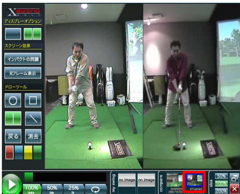
自分の以前のスイングと比較