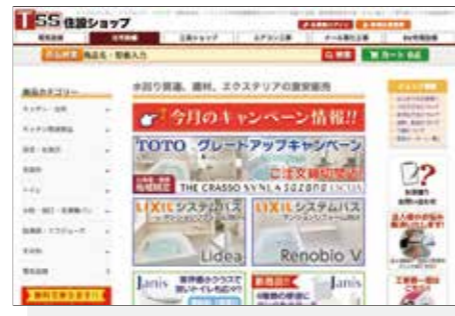
住設ショップ(自社ECサイト)

システムキッチン・システムバス・洗面化粧台・衛生機器・エクステリアなど、住宅の建築に関わる資材の販売および、工事共の総合販売を全国対応にて行っております。