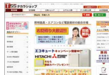
タカラショップ(自社ECサイト)