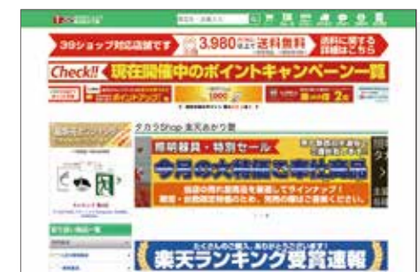
タカラショップ楽天あかり館