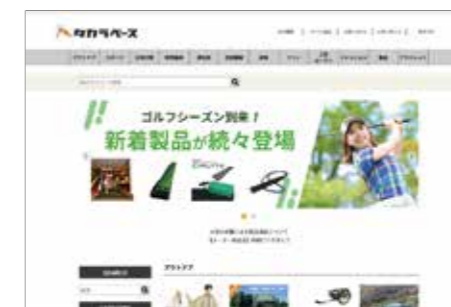
タカラベース(楽天市場)