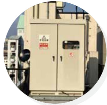
キュービクル工事