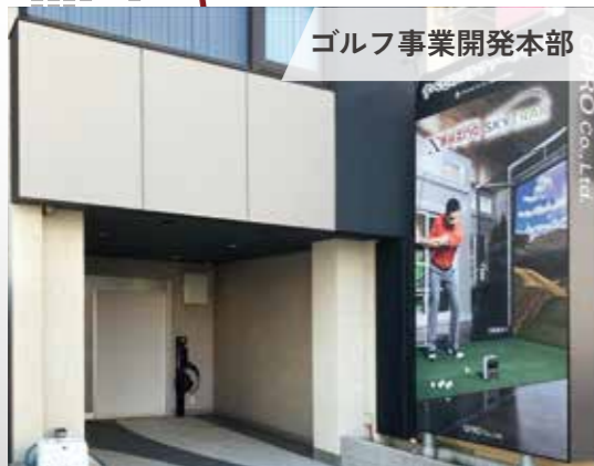
ゴルフ事業開発本部