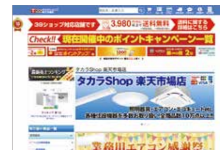
タカラショップ楽天市場店