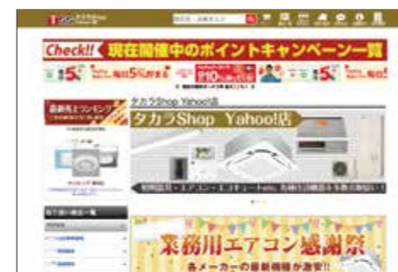
タカラショップYAHOO!店