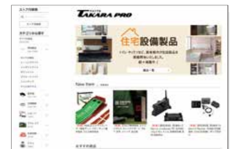
タカラマート・プロ(YAHOO!ショッピング)